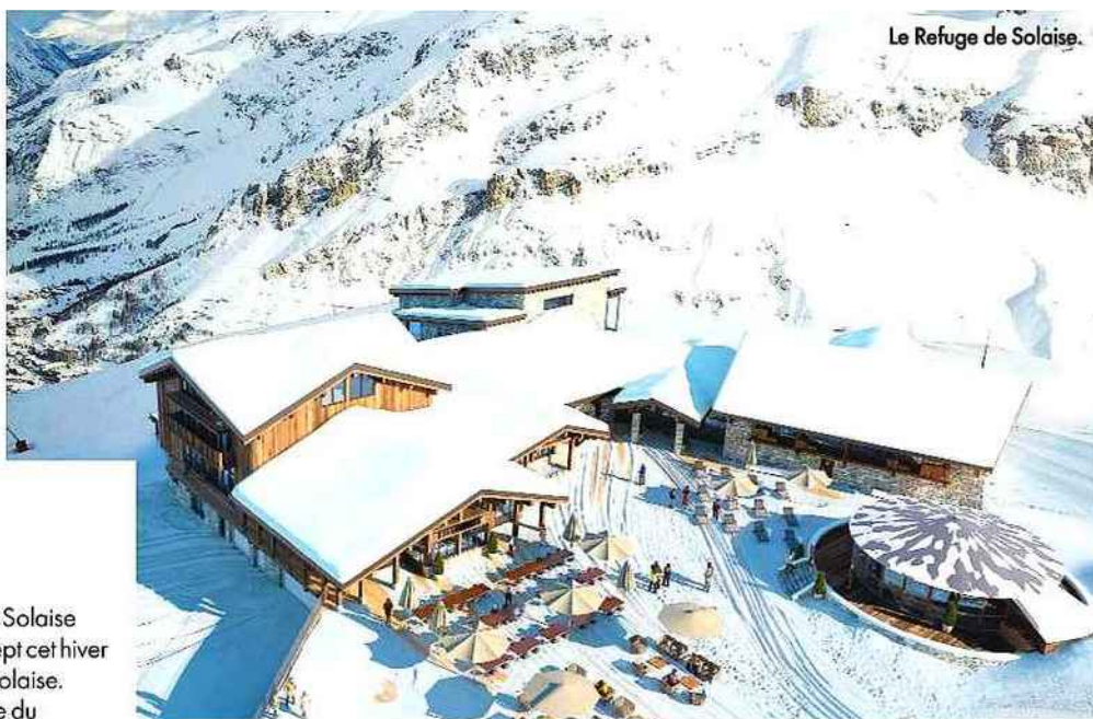
Le Refuge de Solaise.