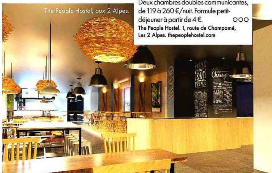
The People Hostel, aux 2 Alpes.

The People Hostel, 1, route de Champamé, Les 2 Alpes. thepeoplehostel.com