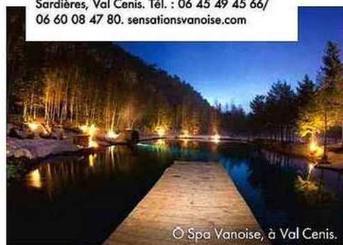
© Spa Vanoise, à Val Cenis.

Dans un superbe cadre naturel, au bord d'un lac aux eaux turquoise, le spa nordique Ô Spa Vanoise à Val Cenis a concocté une formule complète pour se détendre. Accès privatisé au sauna au poêle à bois, bains nordiques chaud et froid, cascade et baignade revigorante dans les eaux du lac... On a l'impression d'être en vacances dans le Grand Nord ! Boisson chaude et serviette de bain fournies. Dès 8 ans. À partir de 28 €/personne pour 1 h. Prix de groupe à partir de 8 personnes. ■ Ô Spa Vanoise. Le Moleney, Sollières-Sardières, Val Cenis. Tél. : 06 45 49 45 66 / 06 60 08 47 80. sensationsvanoise.com