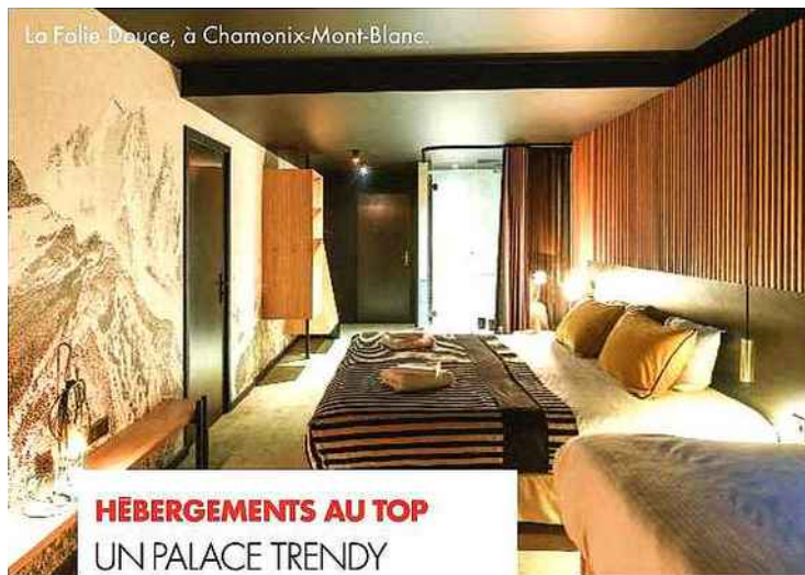
La Folie Douce, à Chamonix-Mont-Blanc.