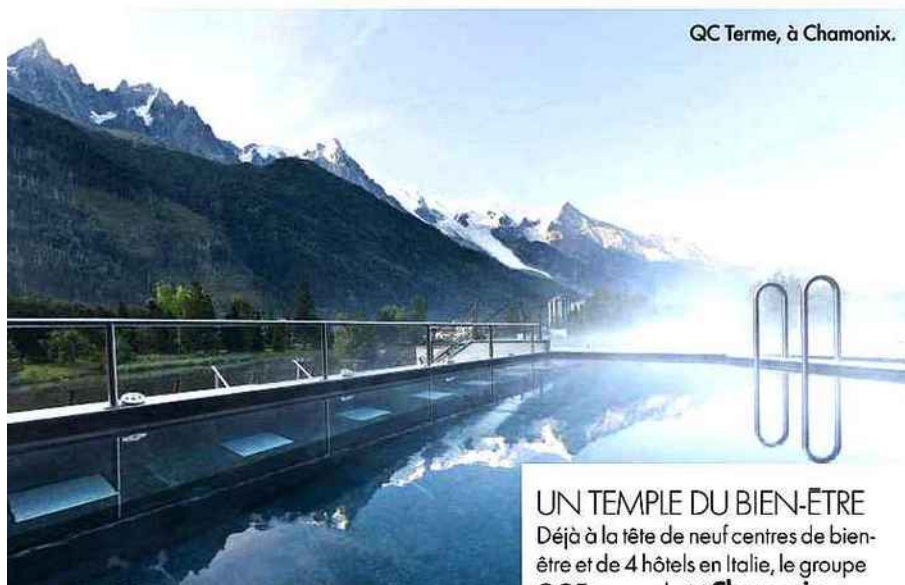
QC Terme, à Chamonix.